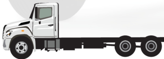
Cabine à essieu (po)