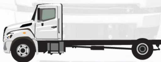
Cabine à essieu (po)